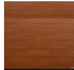
21 Noce sorrento balsamico