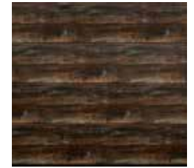
14 Burned Oak