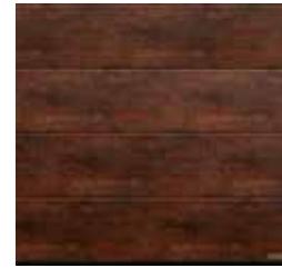
12 Rusty Steel