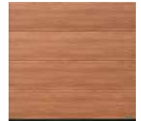
22 Noce sorrento natur