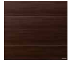
33 Walnuss Terra (Valnød Terra)